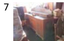
bufetová skříň 1600x1330x650 mm (Pe-78/2016)