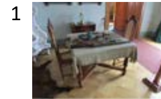
jídelní stůl s židlemi (MVP 24-28/2012)