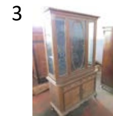
skříň na lovecké pušky 1900x1070x460 mm (Pe-79/2016)