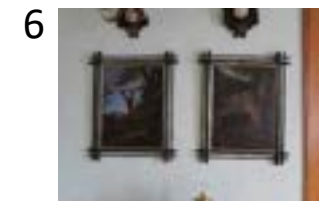
obrazy namalované dle Ridingerových rytin (MVP 280/2012, 281/2012)