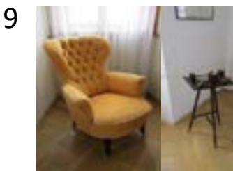
křeslo - ušák, žluté, 1050x750x1000 mm (43/2012) a kuřácký stolek s příslušenstvím 880x290x370 mm (539-541/2012)