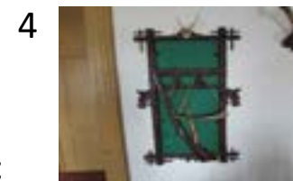
párové věšáky na zbraně (MVP 23/2012)