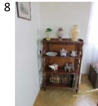
etažer 1270x800x270 mm (31/2012)