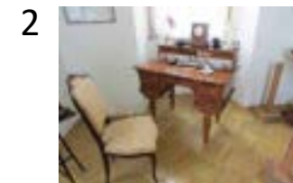
pracovní stůl s židlí knihovna v podobě etažeru (MVP 31/2012, 62/2012, 71/2012)